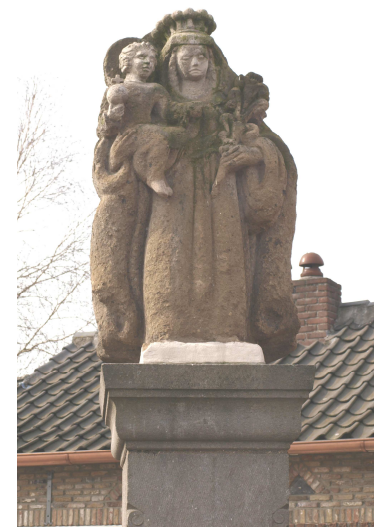
Mariabeeldje aan de Christiaan Huijgensstraat

U kunt zich opgeven bij het secretariaat van de parochie. Wij geven dit dan door aan de koren.