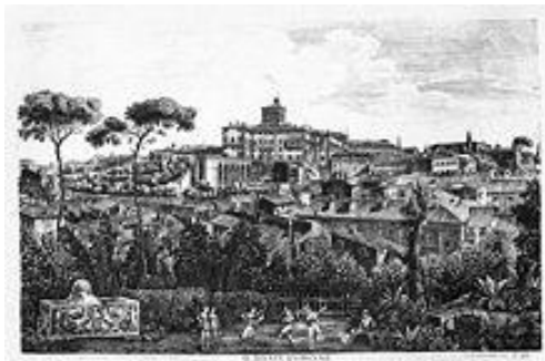
Quirinaal heuvel, afbeelding uit 1827

Rome werd volgens een beroemde legende gesticht door de tweeling Romulus en Remus, op 21 april 753 v.Chr. tussen 8 en 9 uur 's morgens in de landstreek van Latium in Italië. De legende is oorspronkelijk afkomstig van de Romeinse schrijver Marcus Terentius Varro (116-27 v.Chr.). De vroegste geschiedenis is voor een deel in nevelen gehuld. In navolging van de Ilias en Odyssee van de Griekse dichter Homeros werd er met steun van Gaius Iulius Caesar Octavianus (Augustus) door de dichter Vergilius en de historicus Livius een epos over geschreven.