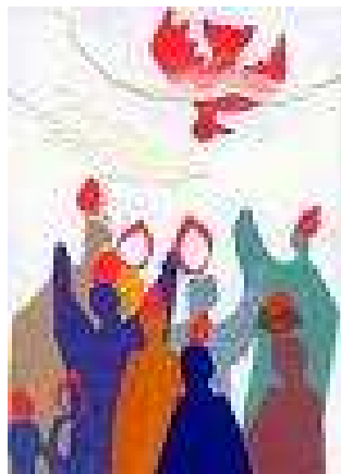
Riet van Overbeek

Ook zij zijn al begonnen aan de voorbereiding, om op de dag zelf goed te weten wat ze beloven, waar ze achter staan.