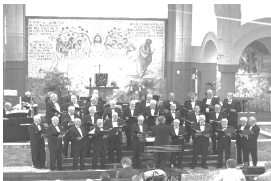
Jubileumconcert van 7 oktober samen met mannenkoor 1001 uit Gilze.

Op 18 november is er een jubileum mis om 10.00 uur. Het koor zingt dan de Missa Dalmatica van Franz von Suppé. Na afloop in de ontmoetingsruimte koffie/thee en een drankje. Harry L.M. Hendriks