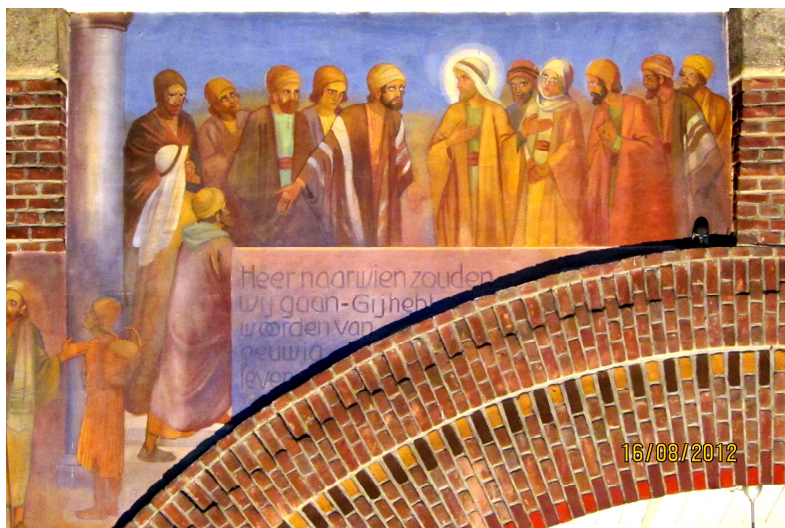
Bijbeltafereel, geschilderd door Piet Gerrits.

In september, op de tweede dinsdag, hebben we het 25jarig bestaan van de Piokapel gevierd. Elke zaterdag en op de tweede dinsdag van de maand wordt in deze kapel eucharistie gevierd. Ook worden alle kindjes hier ten doop gehouden. Een mooie en intieme ruimte en zeker in de winter erg aangenaam, omdat deze kapel gemakkelijk verwarmd kan worden. We hopen er nog lang gebruik van te kunnen maken..